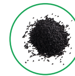
Семена черного тмина